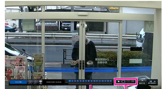
カメラ番号パネル 画面分割ボタン