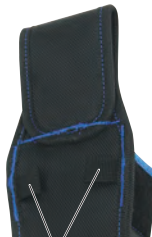
落下防止ワイヤーの取り付 けに便利なループベルト (2カ所、耐荷重:1kg以下)