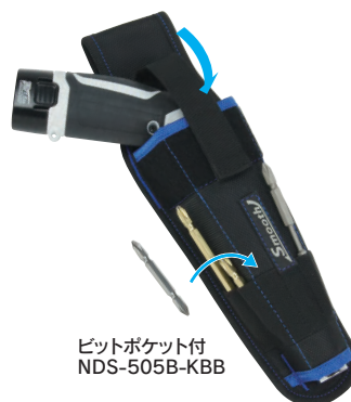
ビットポケット付 NDS-505B-KBB

対応ドライバーサイズ(目安) ストレート型⇔ピストル型 充電ドリルドライバー用 (3.6V, 7.2V対応) φ46mm以下 170mm以下 7.2Vインパクトドライバーにも対応