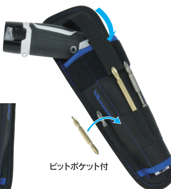
ビットポケット付

対応ドライバーサイズ(目安) ストレート型⇔ピストル型 充電ドリルドライバー用 (3.6V, 7.2V対応) φ46mm以下 170mm以下 7.2Vインパクトドライバーにも対応