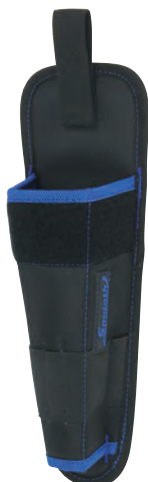
さびにくいステンレス製 金属クリップ