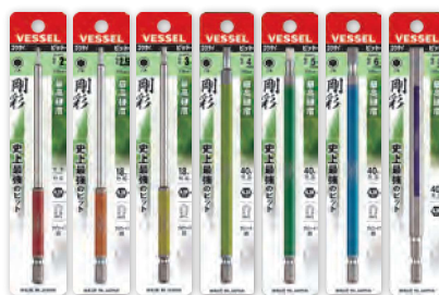
GSH GSH GSH GSH GSH GSH GSH 020L 025L 030L 040L 050L 060L 080L