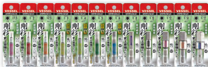
GSH GSH GSH GSH GSH GSH GSH GSH GSH GSH GSH GSH 015S 020S 025S 030S 040S 050S 060S 080S 100S 120S 140S 170S