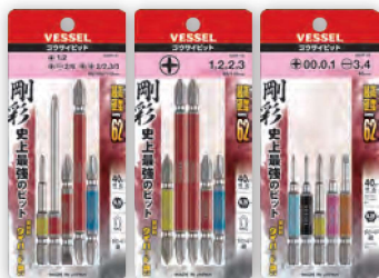
GS5P-01 GS5P-02 GS5P-03