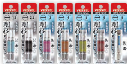
GS16 GS16 GS16 GS16 GS16 GS16 GS16 PL18 PL25 PL30 PL40 PL50 PL60 PL80