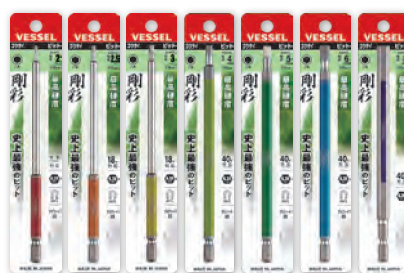
GSH GSH GSH GSH GSH GSH GSH 020L 025L 030L 040L 050L 060L 080L