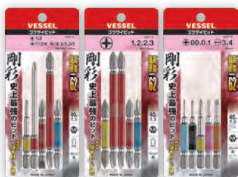
GS5P-01 GS5P-02 GS5P-03