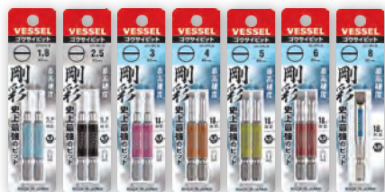
GS16 GS16 GS16 GS16 GS16 GS16 GS16 PL18 PL25 PL30 PL40 PL50 PL60 PL80