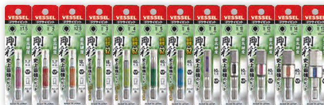
GSH GSH GSH GSH GSH GSH GSH GSH GSH GSH GSH GSH 015S 020S 025S 030S 040S 050S 060S 080S 100S 120S 140S 170S