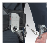
工具落下防止ワイヤー