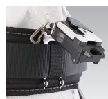
ベルトループを跨げます