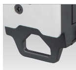
安全ロープ取付環