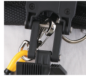
連結部にも安全ロープ が取付可能