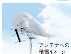
アンテナへの積雪イメージ