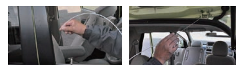
ランチャンネルの潤滑に