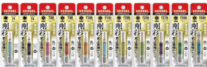
GSVT GSVT GSVT GSVT GSVT GSVT GSVT GSVT GSVT GSVT GSVT 04S 05S 06SH 08SH 10SH 15SH 20SH 25SH 27SH 30SH 40SH