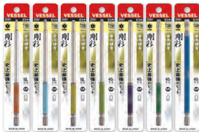
GSVT GSVT GSVT GSVT GSVT GSVT GSVT 10LH 15LH 20LH 25LH 27LH 30LH 40LH