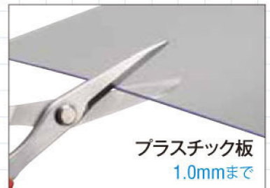
プラスチック板 1.0mmまで