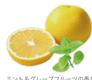
ミント&グレープフルーツの香り