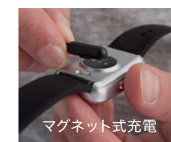
マグネット式充電

※本製品はスマートフォン・アプリ等非接続の仕様となります。※本製品は医療機器ではありません。 ※本製品は体調や疾患の判断を担保するものではありません。 ※本製品は暑熱リスクすべての安全を確約保証するものではありません。結果表示に関わらず体調に違和感がある場合は速やかに対応し、適切に避暑や休養することを推奨します。