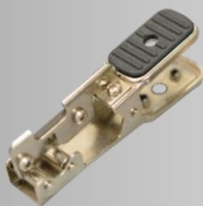
皮むき器ジャケツパ(M) Cable Jacket Stripper (M)